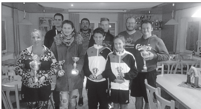
Das Bild zeigt die Vereinsmeister der Titelkämpfe 2016