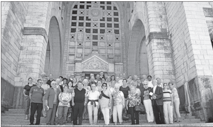
Die Gruppe auf der Kirchentreppe der Kirche der Heimsuchung in Annecy

Auf der Rückfahrt wurde noch einmal in Ars übernachtet und am letzten Tag erfolgte die Heimfahrt über die Schweiz mit einem Gottesdienst und einem Besuch in Annecy mit dem Grab des heiligen Franz von Sales und der heiligen Johanna Franziska von Chantal.