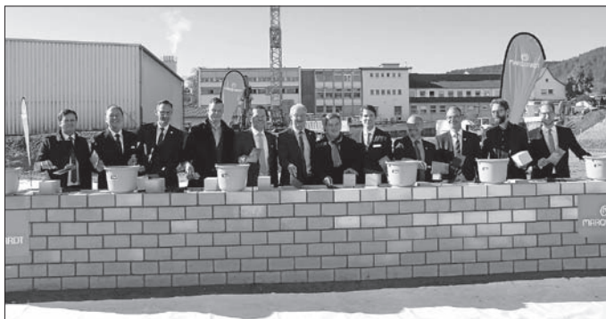
Rietheim-Weilheim, den 13. Oktober 2017 – Noch ist es ein mehrere Tausend Quadratmeter großes Baufeld, das sich

frei über das Marquardt Firmenareal entlang der Schloss-Straße erstreckt. Doch schon Ende 2018 soll das neue Entwicklungs- und Innovationszentrum des Mechatronikspezialisten fertiggestellt sein. Im Beisein von Vertretern aus Politik, Verwaltung und Wirtschaft haben heute die Bauarbeiten mit der feierlichen Grundsteinlegung und dem Einmauern einer Zeitkapsel offiziell begonnen.