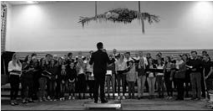
Gemeinsam singen Gemischter Chor und Jugendchor let it be

Die Zeiten, als Vereine sich bei ihren Veranstaltungen voller Säle und Hallen gewiss sein konnten, sind auch auf dem Land längst vorbei. Ein Nullachtfünfzehn-Programm lockt niemand hinterm Ofen vor, vom Sofa runter oder vom Fernseher weg. Abgesehen davon muss so ein Verein erst einmal für aktive Mitglieder attraktiv bleiben, sprich stets neue Mitglieder gewinnen, um überhaupt auftrittsfähig zu sein. So gesehen muss der Gesangverein Eintracht Rietheim e.V. einiges richtig gemacht haben. Viele Besucher/innen beim Herbstkonzert am vergangenen Wochenende, das zudem ganz ohne Gastverein nur mit „eigenen Kräften“ gestaltet wurde, das will schon was heißen.