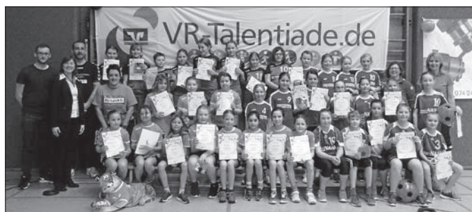
Die Talente der weiblichen E Jugend Staffel 2

Zahlreiche Informationen, Berichte und Fotos sind auch unter: www.vr-talentiade.de zu finden!