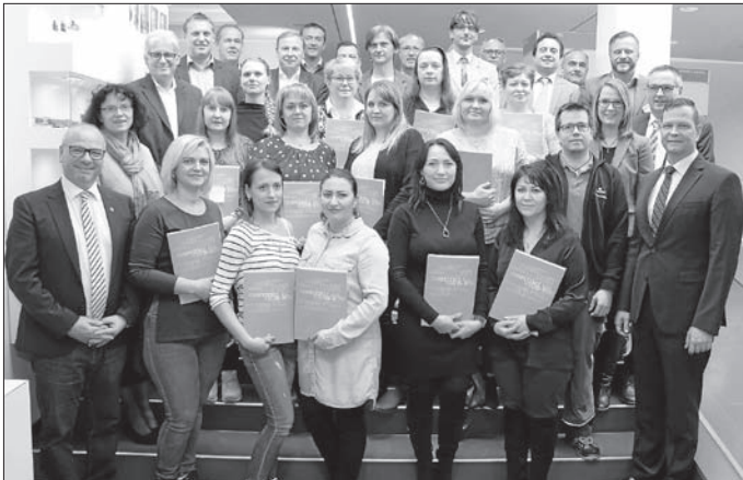
Herzlichen Glückwunsch: Zwölf Marquardt Mitarbeiterinnen schlossen ihre Weiterbildung mit einer Durchschnittsnote von 1,9 ab

Marquardt realisierte das Projekt zusammen mit dem gemeinnützigen Bildungsträger BBQ Berufliche Bildung gGmbH und der Agentur für Arbeit. In einem Jahr absolvierten die Teilnehmerinnen ihre Lerneinheiten direkt im Betrieb. Die BBQ vermittelte die theoretischen Grundlagen, praktische Inhalte lernten die Mitarbeiterinnen in der Marquardt Ausbildungswerkstatt und in den Fachabteilungen. Dazu gehören beispielsweise Fertigungs- und Kunststofftechniken sowie Automatisierung.