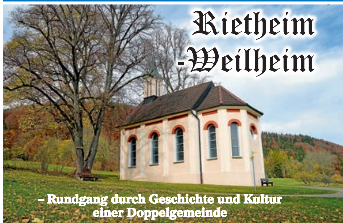
Die Weilheimer Kapelle mit ihrer schönen Aussicht auf das Faulenbachtal liegt auf dem Weg zum ehemaligen Erzstollen.