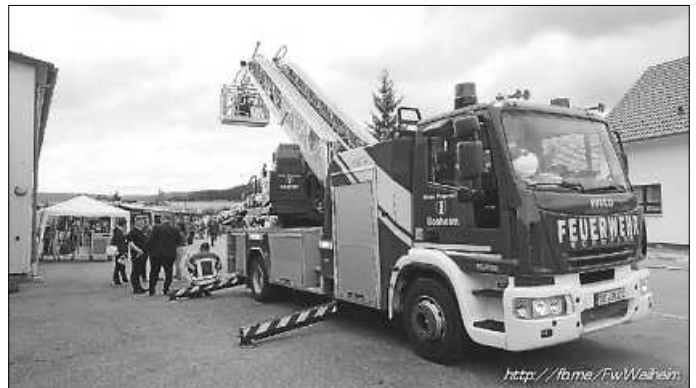
Drehleiter aus Gosheim

Neben dem freien Zugang zum Gebäude gab es eine Vielzahl an Attraktionen. Besonders beliebt war beispielsweise die Drehleiter von unseren Kameraden aus Gosheim – von ganz oben konnte man mal einen Blick über die Dächer von Weilheim wagen – bei klarer Witterung konnte man gut auf die Nachbarorte sehen. Im Einsatz dient die Drehleiter vorrangig zur Menschenrettung aus großen Höhen bzw. überall dort wo tragbare Leitern nicht mehr hinkommen.