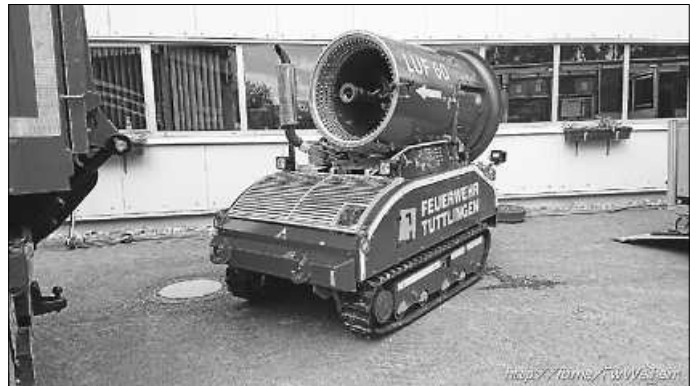
Löschunterstützungsfahrzeug aus Tuttlingen

Ein weiteres Highlight war das Löschunterstützungsfahrzeug (LUF) aus Tuttlingen. Hierbei handelt es sich um ein kettengetriebenes, ferngesteuertes Fahrzeug, das mit einer Turbine mit Wasserwerfer und Wassernebeldüsen ausgestattet ist. Dieses Fahrzeug bietet eine Fülle taktischer Möglichkeiten. So kann es beispielsweise bei Großbränden eingesetzt werden oder überall dort wo es zu gefährlich wäre Menschen hineinzuschicken.