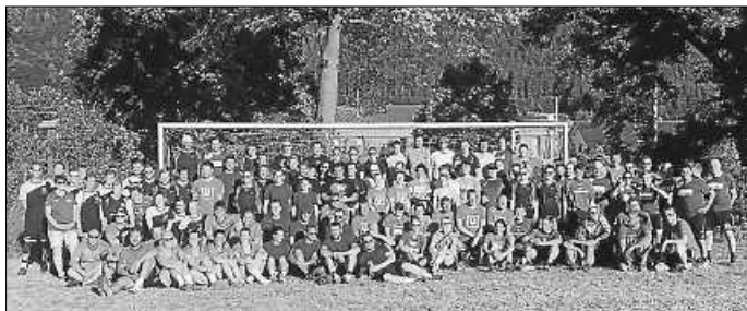
Gemeinsames Gruppenfoto aller 9 teilnehmenden Mannschaften

Nach dem Turnier und mit der Eröffnung der Bar ging das Turnier in die 3. Halbzeit, bei der wieder bis weit nach 0 Uhr gefeiert wurde. Alles in allem war das Turnier mal wieder ein voller Erfolg, wir freuen uns bereits jetzt auf nächstes Jahr.