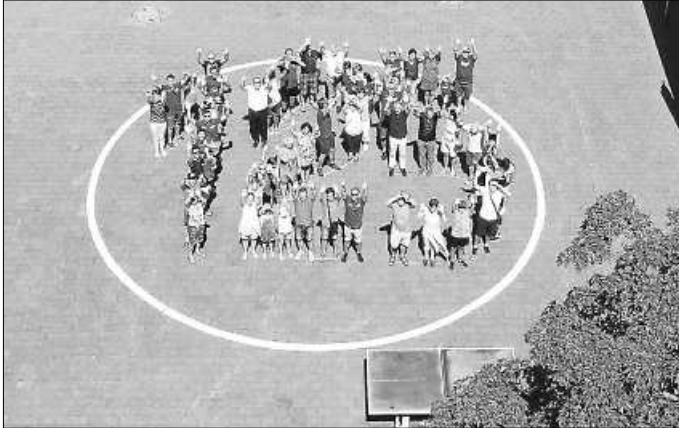
„125“ Jahre TSV Rietheim

strahlendem Sonnenschein mit einem ökumenischen Gottesdienst in der Gemeindehalle, der dann direkt in den gemeinsamen Frühschoppen überging, welcher von den „Moonlights“ begleitet wurde.