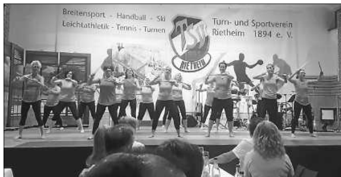
Die Aerobic Drums im Einsatz beim Galaabend

Abgerundet wurde der Abend von der Show-Band „Middle Ages“.