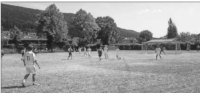
Die Auswahl des TSV beim Großfeld-Handballspiel im Einsatz gegen eine Auswahl des Bezirks Neckar-Zollern

Der finale Abschluss des Wochenendes war das Großfeld-Handballspiel zwischen einer TSV Auswahl gegen eine Auswahl des Bezirks Neckar-Zollern, welches ganz im Sinne des 125-jährigen Jubiläums Tradition und Zukunft miteinander verbinden konnte.