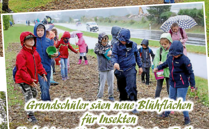
Grundschüler säen neue Blühflächen für Insekten Herbsteinsaat im Projekt Buntres Treiben Blühender Naturpark Obere Donau