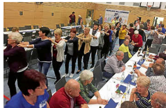
Die super Stimmung gipfelte in einer Polonaise