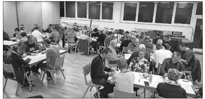
Die Binokler in Aktion