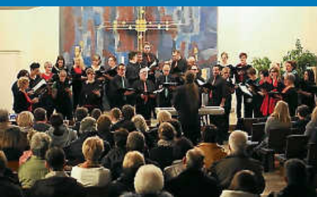
Werkstattkonzert in der Kirche in Rietheim