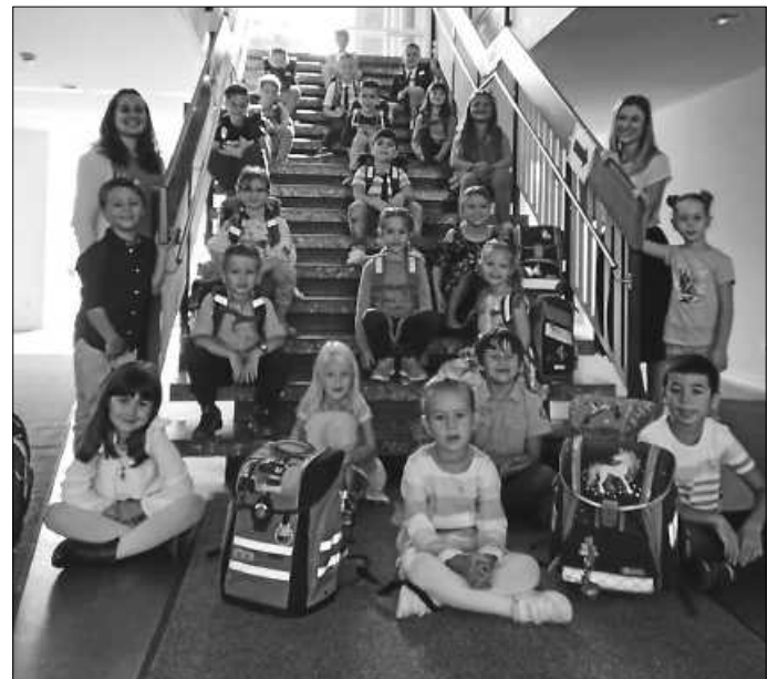
Die neuen Erstklässler