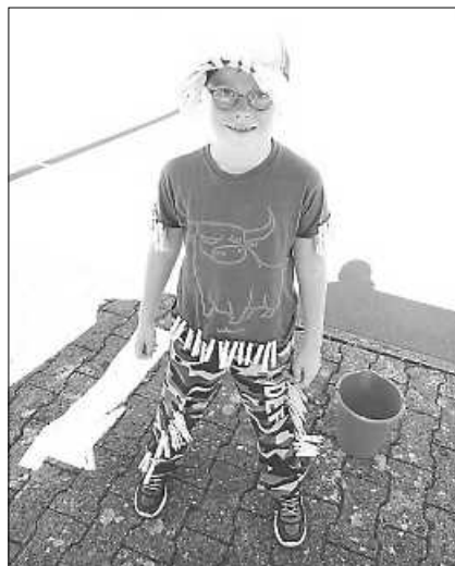
Ganz schön viele Wäscheklammern

Die Kinder konnten die gefundenen Tischtennisbälle gegen eine Seifenblasenpistole eintauschen.