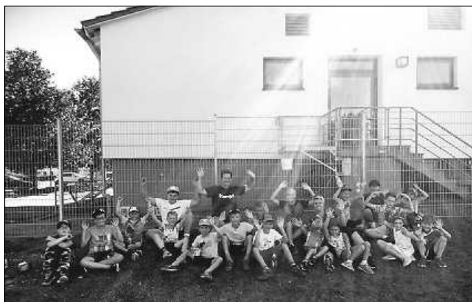
Die Kinder und Betreuer beim diesjährigen Kinderferienprogramm

Am Freitag, 4.9.2020 trafen sich bei tollstem Wetter 20 Kinder und Betreuer unter Corona-Bedingungen zum diesjährigen Ferienprogramm vom TSV. Auf dem Kleinspielfeld haben die Verantwortlichen einiges vorbereitet.