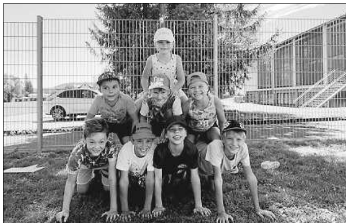
Alle hatten einen riesen Spaß bei bestem Wetter

Als Abschluss der Aufgaben sollte jedes Kind einen Tischtennisball in der Sprunggrube finden. Was sich als gar nicht so einfach herausstellte.