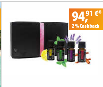
Forever Essential Oils Aromatherapie-Öle Combo Box