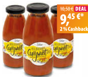
Söllner Heilbronner Currywurstsoße 3er Set

Neben den Eigenmarken Söllner und lovely bietet dir das Familienunternehmen zudem Produkte der Marken 741 Gin und Knödelkult. Ob Curry-, Barbecue- oder Schaschlik-Soße, hier ist für jeden Geschmack etwas dabei.