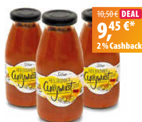
Söllner Heilbronner Currywurstsoße scharf