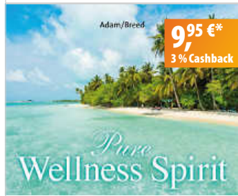
Adam/Breed Pure Wellness Spirit