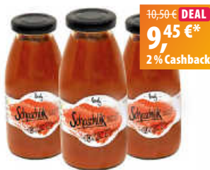
lovely Schaschlik Soße 3er Set