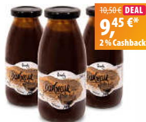
lovely Barbecue-Soße 'Texas Style' 3er Set