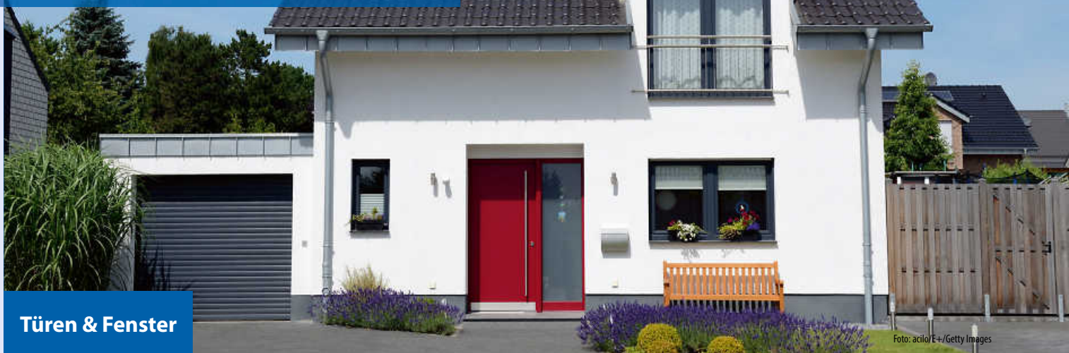
Türen & Fenster