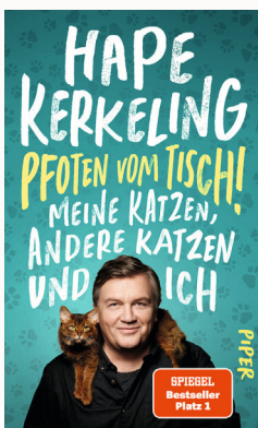
Kerkeling, Hape: Pfoten vom Tisch Piper Verlag, 293 S. EUR 22,-

Wer sich überlegt, eine Katze anzuschaffen und kein trockenes Sachbuch dazu lesen will, dem sei „Pfoten vom Tisch“ ans Herz gelegt. So abwechslungsreich und erheiternd könnte ein reiner Katzenratgeber niemals sein. Gerade die Mischung aus persönlichen Erfahrungen und allgemeinen Ratschlägen macht das Buch, das zu Recht zum Bestseller wurde, so gut zu lesen. Die historischen Hintergründe, wissenschaftlichen Fakten, kuriosen Katzensgeschichten aus aller Welt oder die Übersicht über Katzenrassen sind ebenso unterhaltend geschrieben wie seine persönlichen Katzenerlebnisse. Zum Beispiel bekam er seine Kater Samson und Spock von einer Art Messie-Familie – diese Begegnung scheint ihn